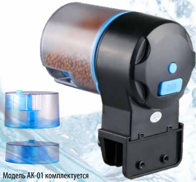
Модель AK-01 комплектуется двумя контейнерами – на 50 мл и на 100 мл