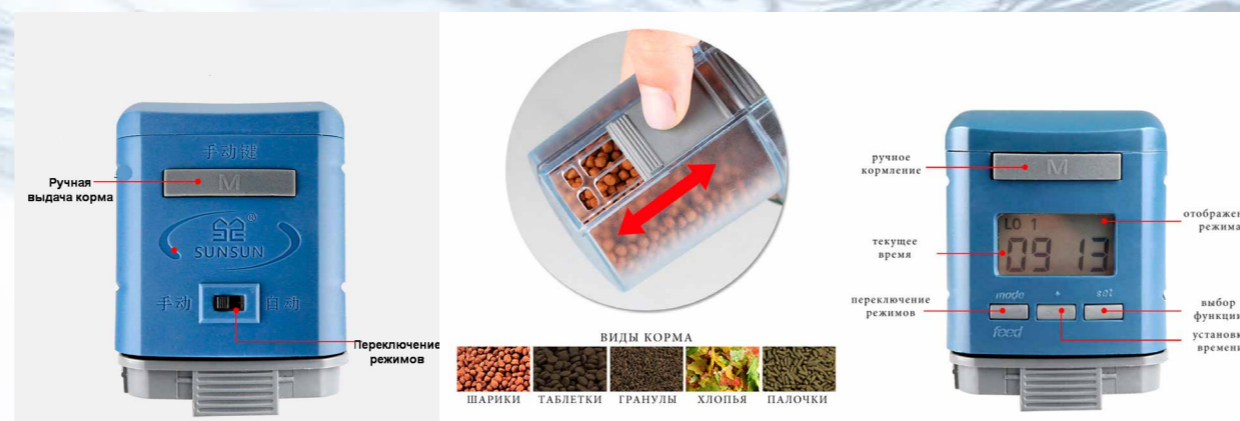
Переключение режимов и регулировка порции по видам корма для моделей SX-11G (слева) и SX-11Q (справа). Модель SX-11Q отличается наличием ЖК-экрана с индикацией времени и режима.